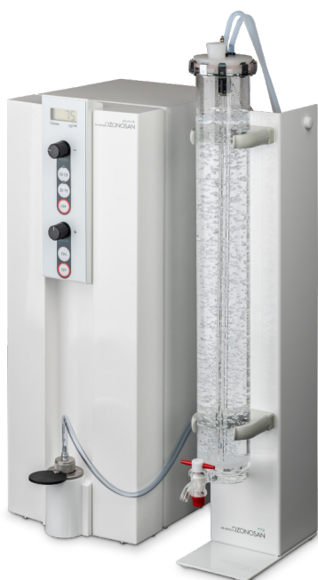
OZONOSAN photonik mit WOG

Das OZONOSAN photonik ist als Tischgerät ideal für Anwendungen in kleineren Arztpraxen. Dieses System erzeugt Ozonkonzentrationen zwischen 2 und \leq 75 \mu\text{g/ml} für alle systemischen und topischen Anwendungen. Eine Wasserozonisierungseinheit ist separat erhältlich.